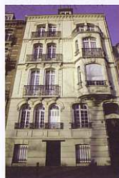
Boulevard de Strasbourg

17 novembre, 15 décembre, 19 janvier, 16 février, 15 mars, 19 avril, 17 mai