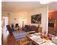
Appartement témoin Perret