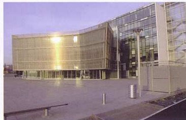
Chambre de Commerce et d'Industrie

RDV devant le conservatoire Arthur Honegger - 70, cours de la République Réservation conseillée au 02 35 21 27 33