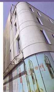
Conservatoire Arthur Honegger

Découvrez quelques réalisations emblématiques : le conservatoire Arthur Honegger inauguré en 2002 (cabinet Brunet et Saunier),