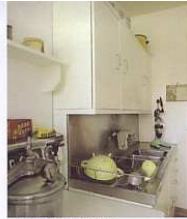
L'appartement témoin Perret

Chapelle Saint-Michel d'Ingouville Panorama sur Le Havre Le circuit de la Transat en car Panorama sur Le Havre Chapelle Saint-Michel d'Ingouville