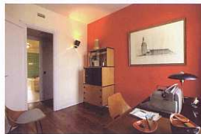
Appartement témoin Perret

Ces ateliers menés par des guides-conférenciers vous proposent de découvrir, en famille, le patrimoine havrais. Accompagné d'un adulte, votre enfant expérimente, manipule et réalise des travaux qu'il garde en souvenir.